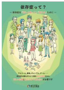
〔啓発ポスター〕 (内閣官房)